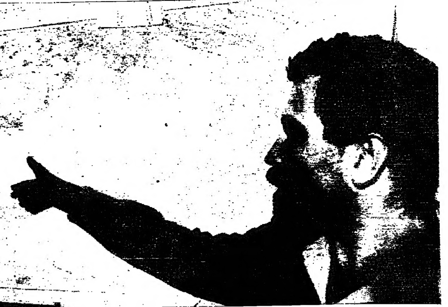
صاحب بحري اسرائيلي يشير على الخارطة الى المكان الذي يعتقد ان القنصلية الاسرائيلية قُتلت فيه بالتفجير في بيروت